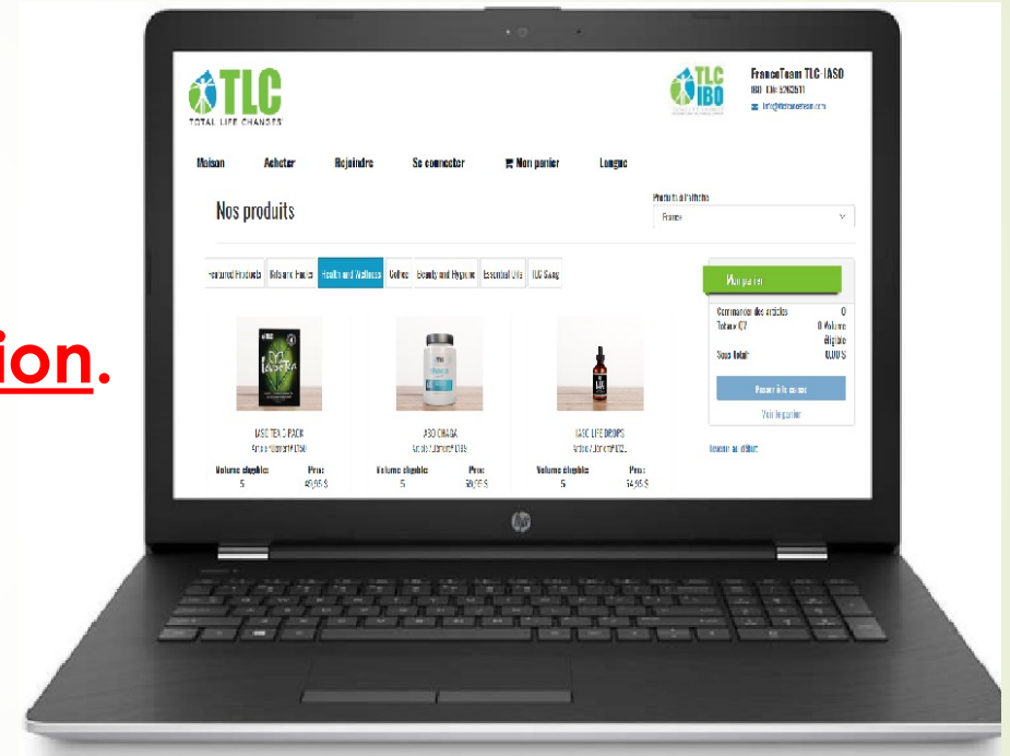
Boutique en ligne / e-commerce