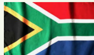
Afrique du Sud